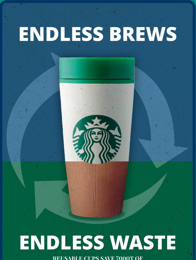
Afbeelding 4: Campagneposter na feedback