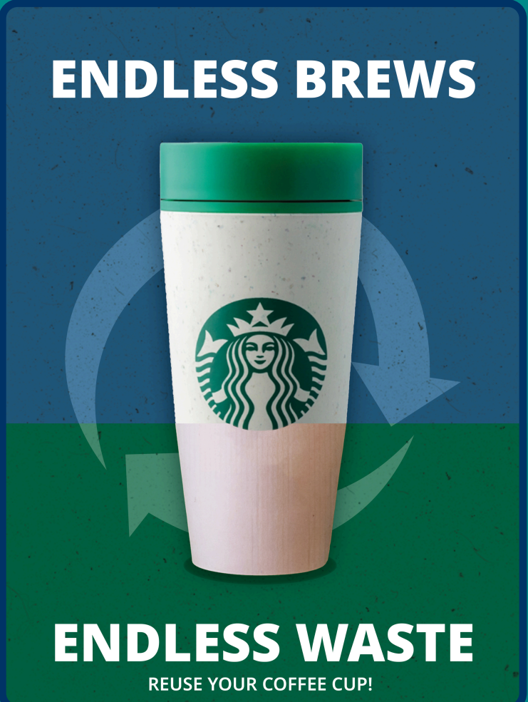
Afbeelding 3: Campagneposter voor feedback

Door deze aanpassingen is niet alleen de visuele kwaliteit van mijn ontwerpen verbeterd, maar heb ik ook mijn werkwijze efficiënter gemaakt. Door vooraf meer te schetsen en beter onderbouwde keuzes te maken, kan ik sneller itereren en effectiever omgaan met feedback. Dit heeft gezorgd voor een strakker en doordachter eindresultaat in zowel mijn magazine spread als mijn campagneposter.