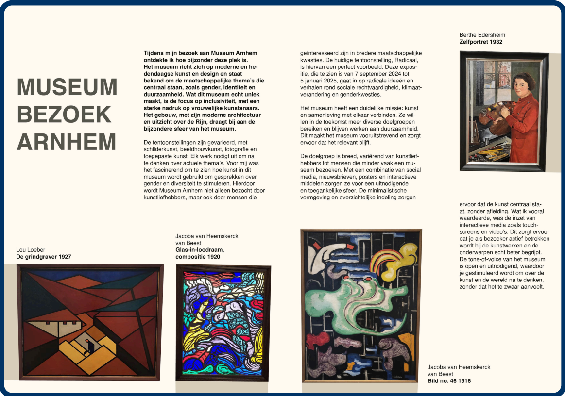
Afbeelding 1: Magazine Spread voor feedback